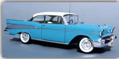
Voici un exemple d'utilisation du Chrome et du Matte Aluminium Bare-Metal®Foil sur cette magnifique Chevrolet 1957.

Bare-Metal® Foil est la solution idéale pour reproduire l'aspect chromé sur des maquettes de voitures, de camions, d'avions ainsi que sur des miniatures. Bare-Metal® Foil est une très fine pellicule autocollante qui peut être appliquée tant sur une surface peinte que directement sur le plastique. Grâce à sa finesse, elle épouse parfaitement chaque courbe du modèle. Bare-Metal® Foil est disponible en Chrome, Ultra Brite Chrome, Black Chrome (noir), Gold (doré), Matte Aluminium (aspect mat), and Real Copper (cuivre). Les feuilles peuvent être appliquées sur toute surface propre. Notre système de collage par pression est très doux et n'endommagera pas la mise en couleur des modèles. Vu la finesse du Bare-Metal® Foil, Il est très important d'utiliser un scalpel avec une lame neuve pour découper la feuille sans la déchirer. Si dans de très rares situations, le collage s'avère difficile, il est possible de le renforcer en utilisant le MICROSCALE (MI-8) MICRO METAL FOIL ADHESIVE.